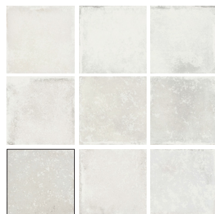
SAVANNAH WHITE 10X10 / 4"X4" L23/M