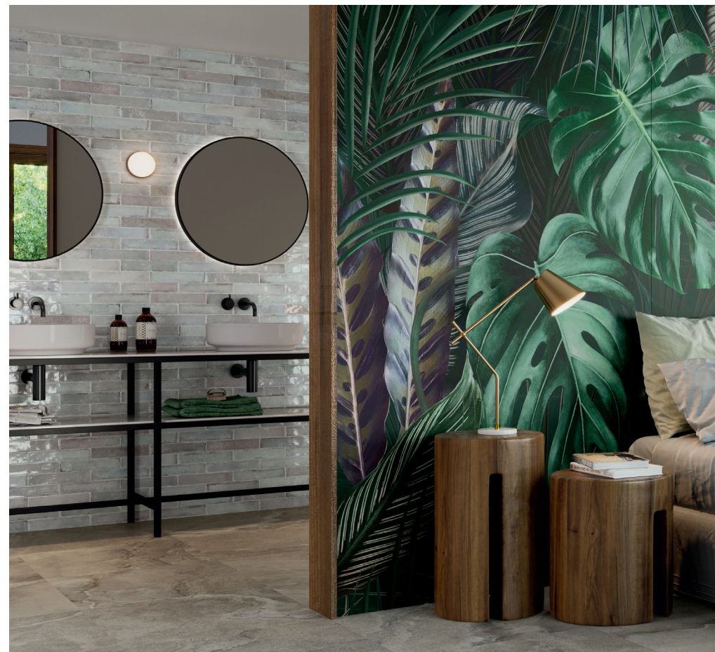
DECORVISAYA I 120X260 / DECORVISAYA II 120X260 / PUMICE MATT RECT 60X120 / CROSSTAUPE RECT 60X60 / SAVANNAH GREY 5X25