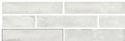
SAVANNAH WHITE 5X25 / 2"X10" L22/M