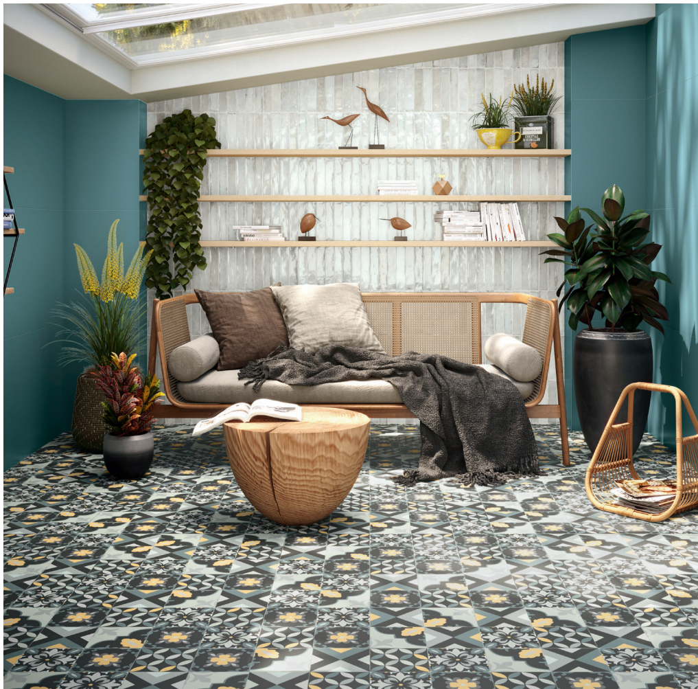
DAHLIA NIGHT 15X15 / SAVANNAH WHITE 5X25 / TRIANA DESIERTO RECT 20X120 / TIDE MATT RECT 60X120