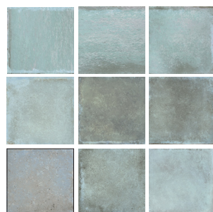
SAVANNAH BERILO 10X10 / 4"X4" L23/M