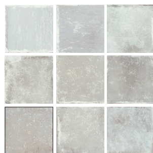
SAVANNAH GREY 10X10 / 4"X4" L23/M